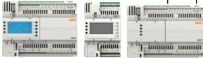
серия FREE ADVANCE AVD/AVC

Контроллеры серий AVD/AVC (FREE ADVANCE) - Локальный (EVD) и/или удаленный (EVK) графический интерфейс, среда программирования FREE STUDIO