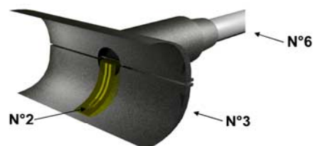
Sensor internal / Interno capsula